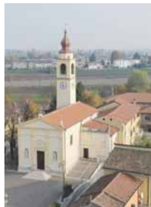
La parrocchia di Asparetto

Ma veniamo al programma. A tagliare il nastro l'8