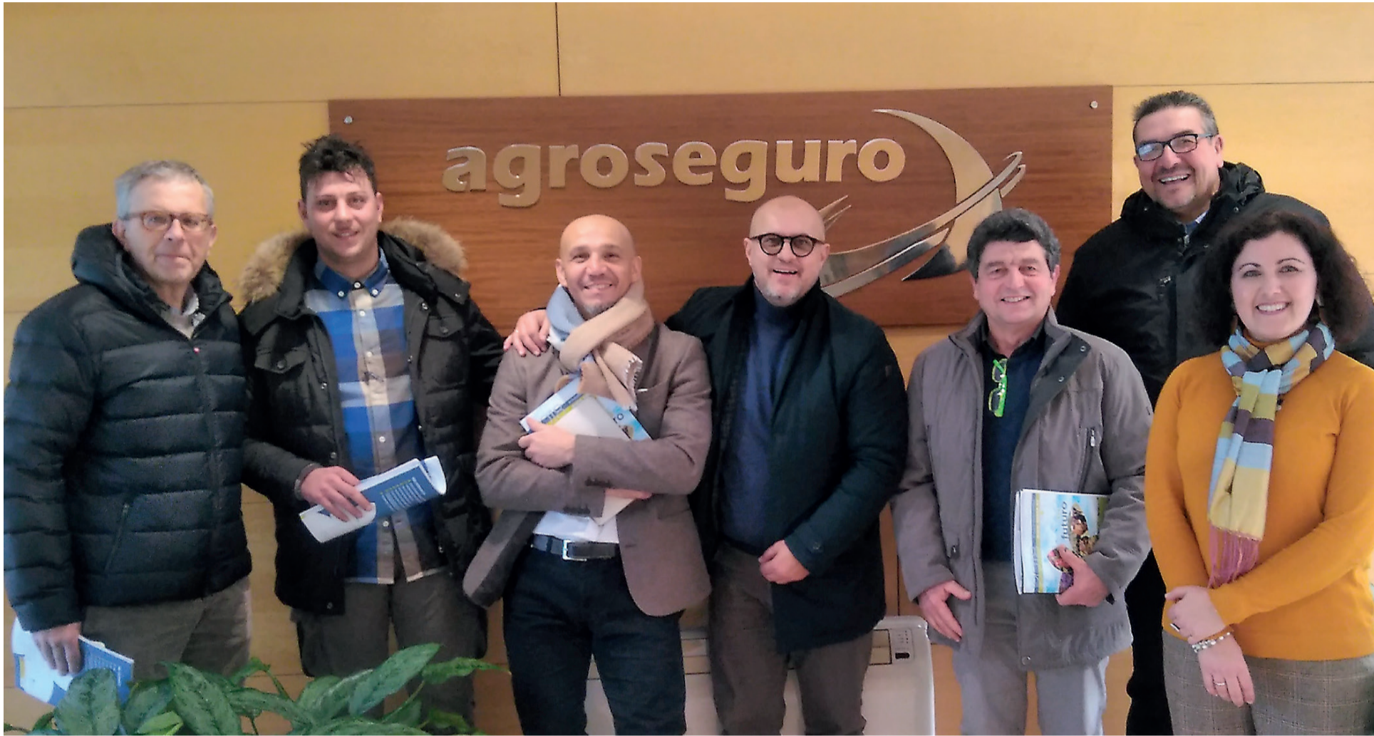
L'incontro di CO.DI.P.A. si è svolto presso la sede di Agroseguro a Madrid

na, negli ultimi anni ha ampliato la sua operatività in tutto il territorio nazionale, con lo scopo di sottoscrivere polizze collettive con le compagnie assicurative in qualità di contraente.