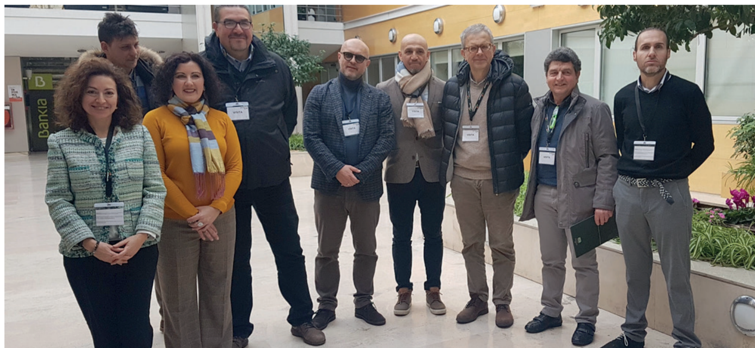
La delegazione del CO.DI.P.A. era composta dal Presidente, alcuni Consiglieri, il Direttore e consulenti

Il valore assicurato realizzato da CO.DI.P.A. per la campagna assicurativa 2018 è di 176.200.723 euro e i premi assicurativi ammontano a 20.882.681 euro. I quintali assicurati nell'anno 2018 sono stati 3.756.963 milioni, per un totale di 17.000 ettari. I soci registrati dal consorzio sono in continua crescita raggiungendo ora più di 5.500 iscritti in tutta Italia.